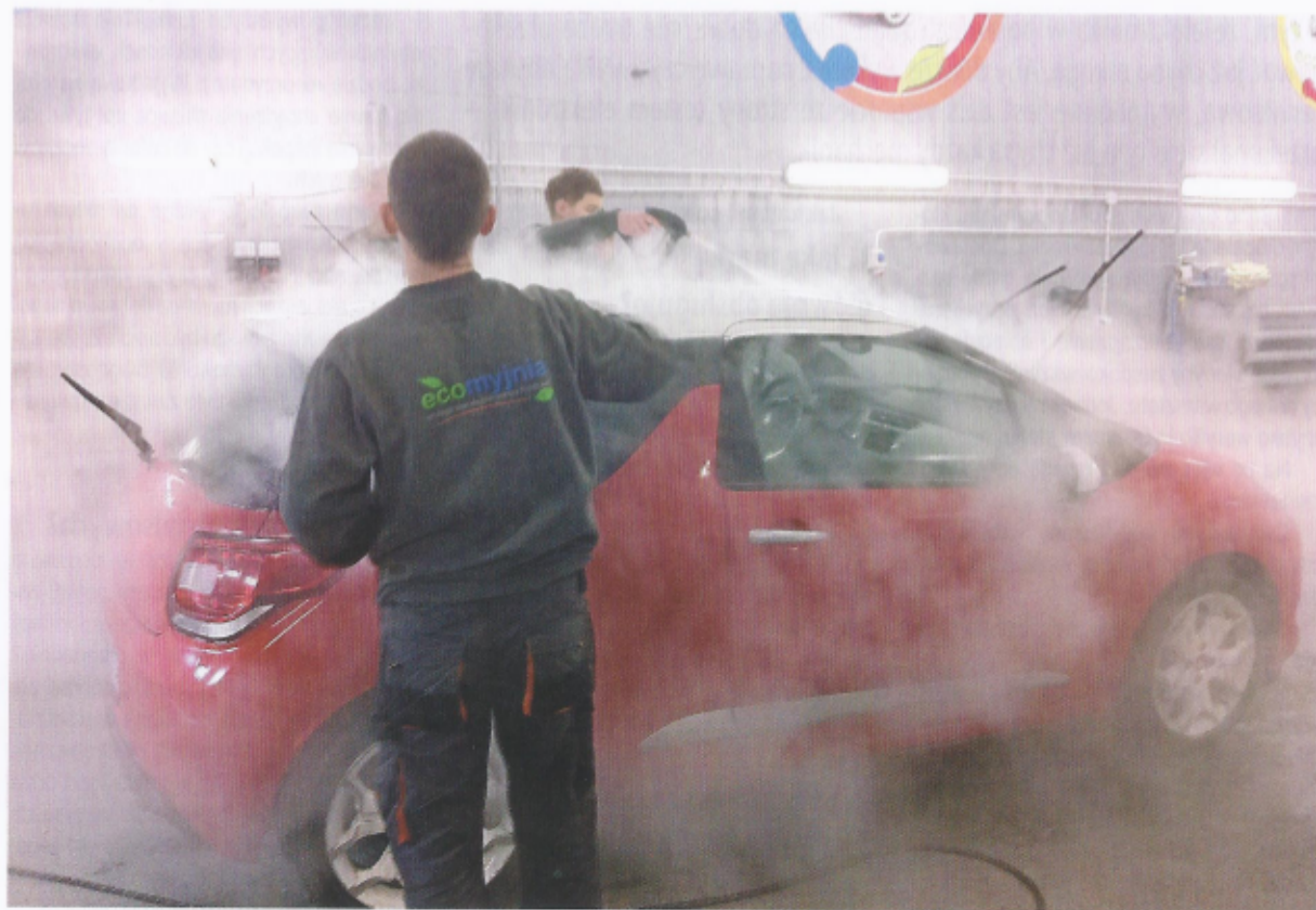
Podczas gdy obsługa auta w myjni wodnej oznacza zużycie wody na poziomie 100-150 litrów, myjnia parowa zużywa jej zaledwie 10 litrów.

Firma, której właścicielem jest nasz rozmówca, nie tylko zajmuje się kompleksowym wyposażaniem myjni, ale i tworzy własną sieć – Ecomyjnia.